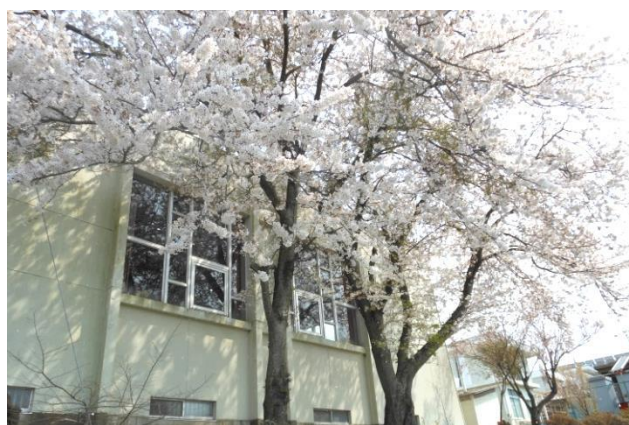
平成 20 年頃（春には桜が満開に）