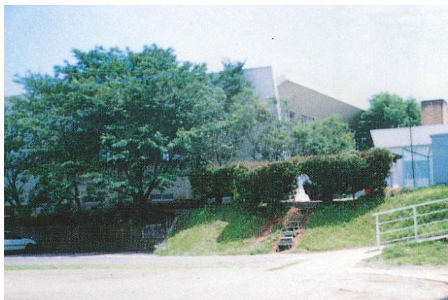
平成 2 年頃（緑に囲まれた体育館）

昭和 48 年 9 月に体育館が建築されました。（鉄骨造・平屋 530 m 2 ） 室内球技設備も完備され、運動以外にも様々な行事等で利用してきました。