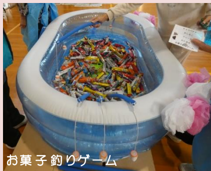
お菓子釣りゲーム