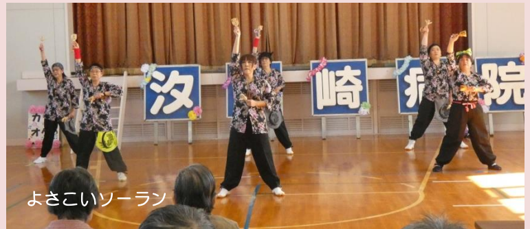
よさこいソーラン