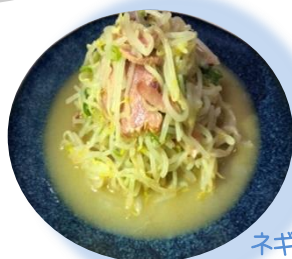
ネギ塩タンもやし

前号でご紹介したところ 写真のリクエストがあり、 作らせていただきました。 レシピは66号をご覧ください。 (菅原)