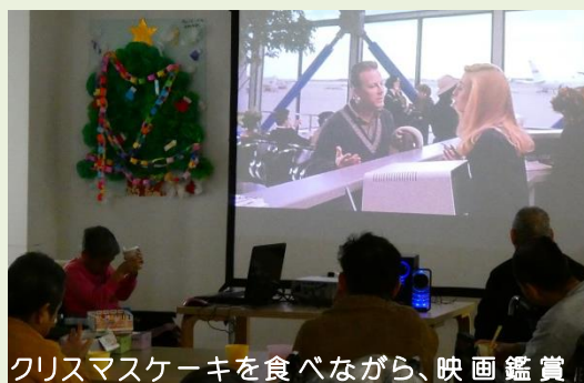
クリスマスケーキを食べながら、映画鑑賞