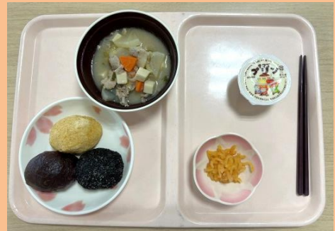
三食ぼた餅・豚汁・お漬物・プリン