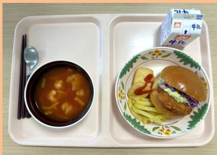
アポカドタルタルフィッシュバーガー トマトスープ・牛乳・ フライドポテト&ナゲット