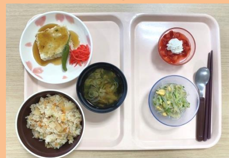
たけのご飯・すまし汁・つくね・ 春雨とキュウリの酢の物・いちごプリン