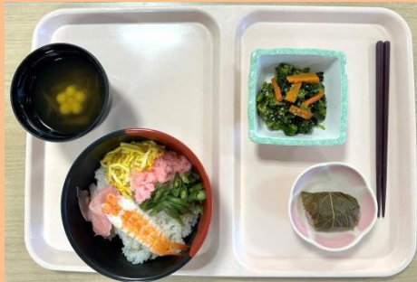
ちらしずし・花麩のすまし汁・ 菜の花のゴマ和え・桜餅